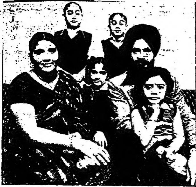
عائلة هندية يلاحقها التمييز العنصري في كندا

التمييز العنصري في كندا لسبعه اليوم من النوع المستتر الخبيث الذي يطعن في الظلام ومن خلف الظهور ، وينادي بتفوق الإنسان الأبيض ، ويحاول قسر الكنديين على اعتبار المهاجرين غير البيض مواطنين من الدرجة الثانية أو الثالثة وغير جديرين بالجنسية الكندية . ان التعصب العنصري يتخذ اليوم في كندا وجها اخر قبيحا علينا ولم يعد يخشى التستر تحت اقمعة الجمود الكندي المعروف .